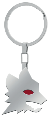
B-RP001XAR € 31,90