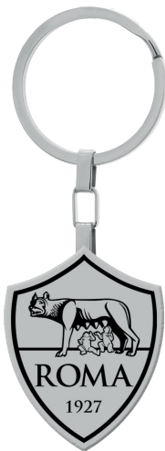
B-RP002XAS € 31,90