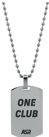
B-RC005UAS € 31,90