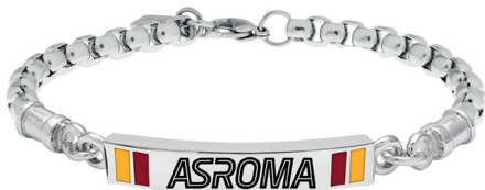
B-RB002UAS massima regolazione 22 cm minima regolazione 18,5 cm € 41,90