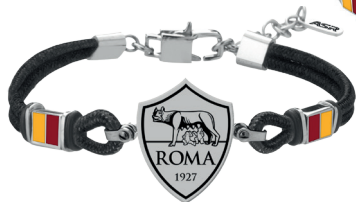
B-RB003UCN € 41,90