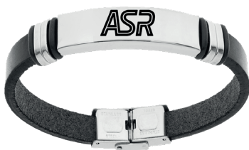
B-RB010ULN € 31,90 regolazione a piacere