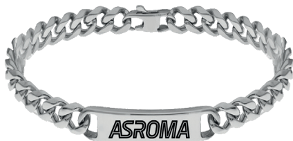
B-RB008UAS massima regolazione 22 cm minima regolazione 18,5 cm € 36,90