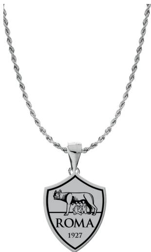
B-RC002UAS € 36,90