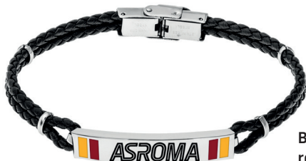
B-RB001UCN regolabile a piacere € 41,90