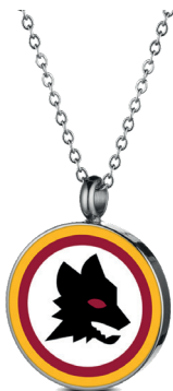
B-RC001UAR € 36,90