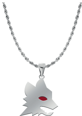
B-RC003UAR € 36,90