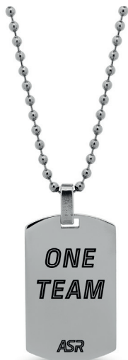
B-RC007UAS € 31,90