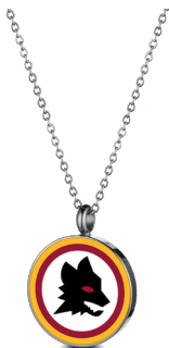
B-RC001KAR € 36,90

Lunghezza catena 50 cm. massima regolazione 48 cm minima regolazione 44 cm