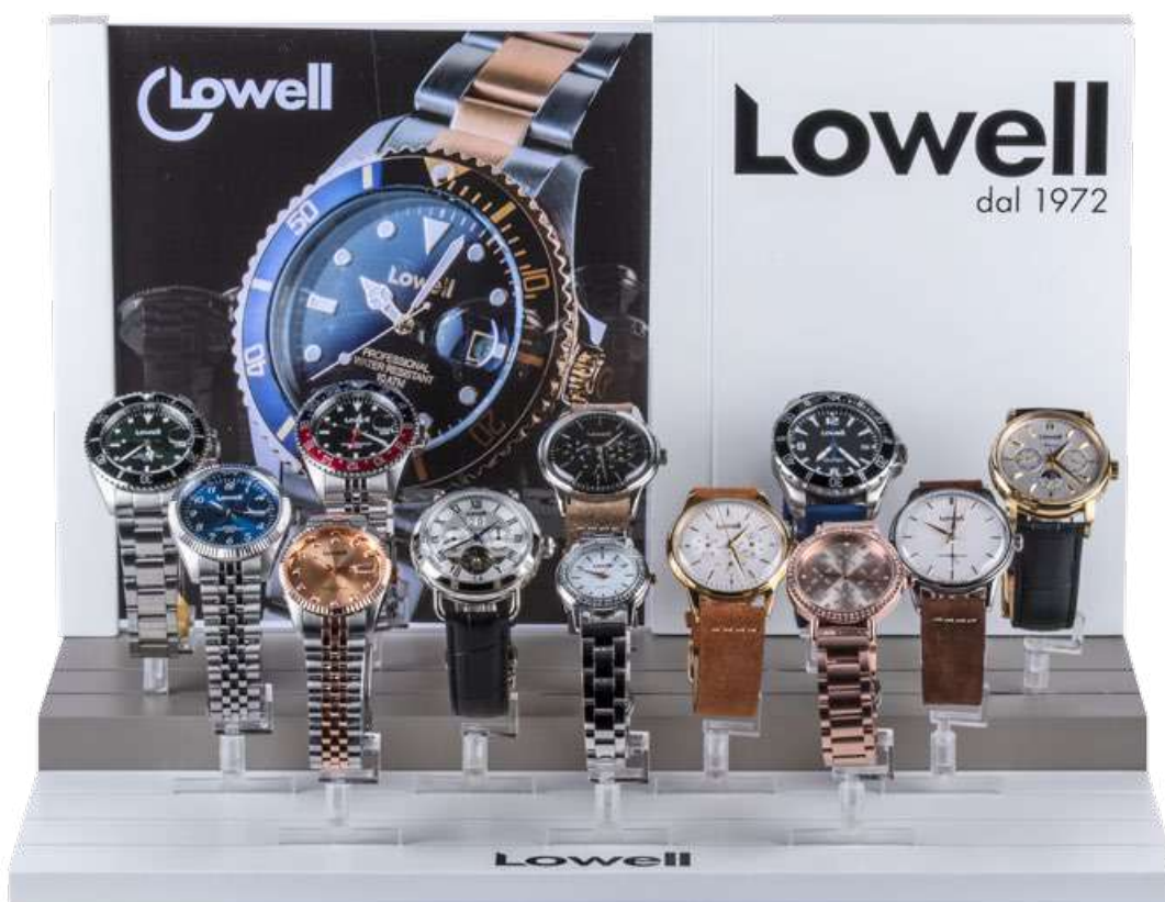
PV-ESP-C13A B 36 cm. x H 24 cm. x P 24 cm